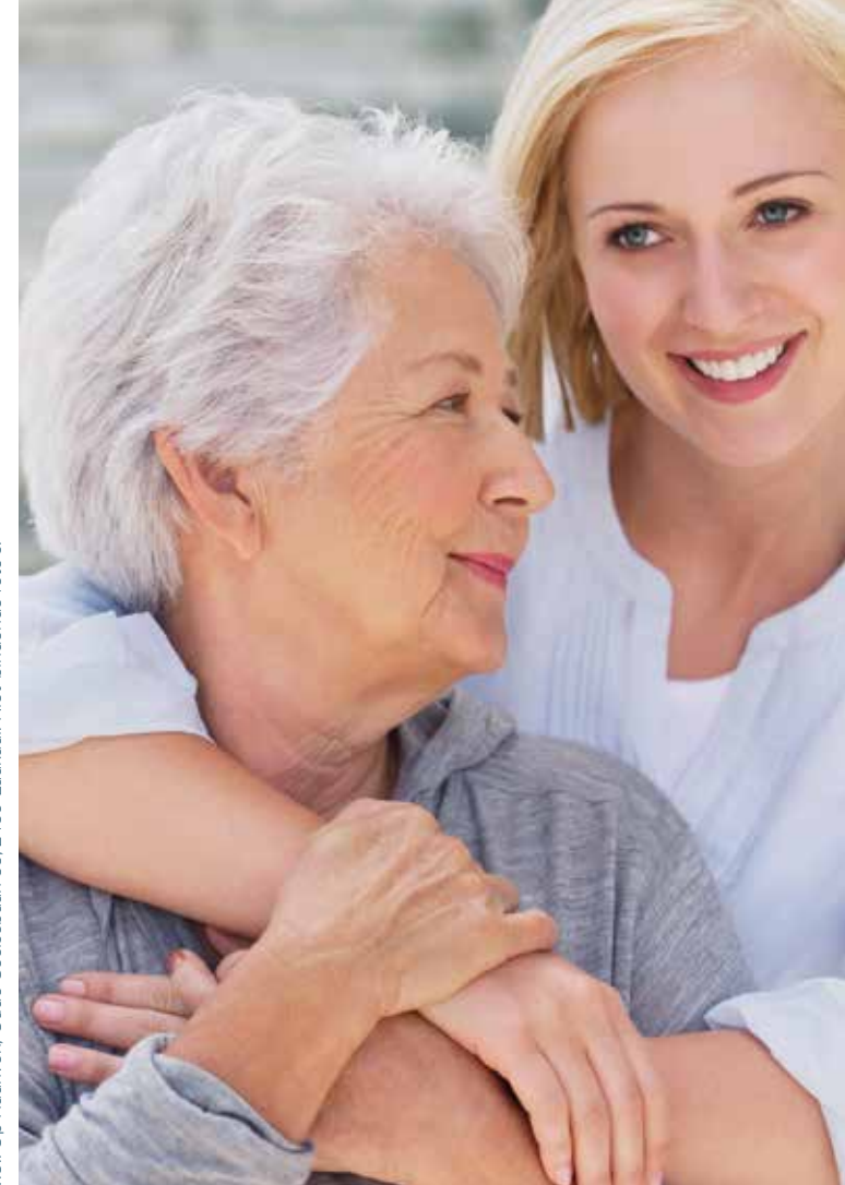
V.U.: Op Haanven, Oude Geelsebaan 33, 2430 Laakdal. Niet-bindende foto's.