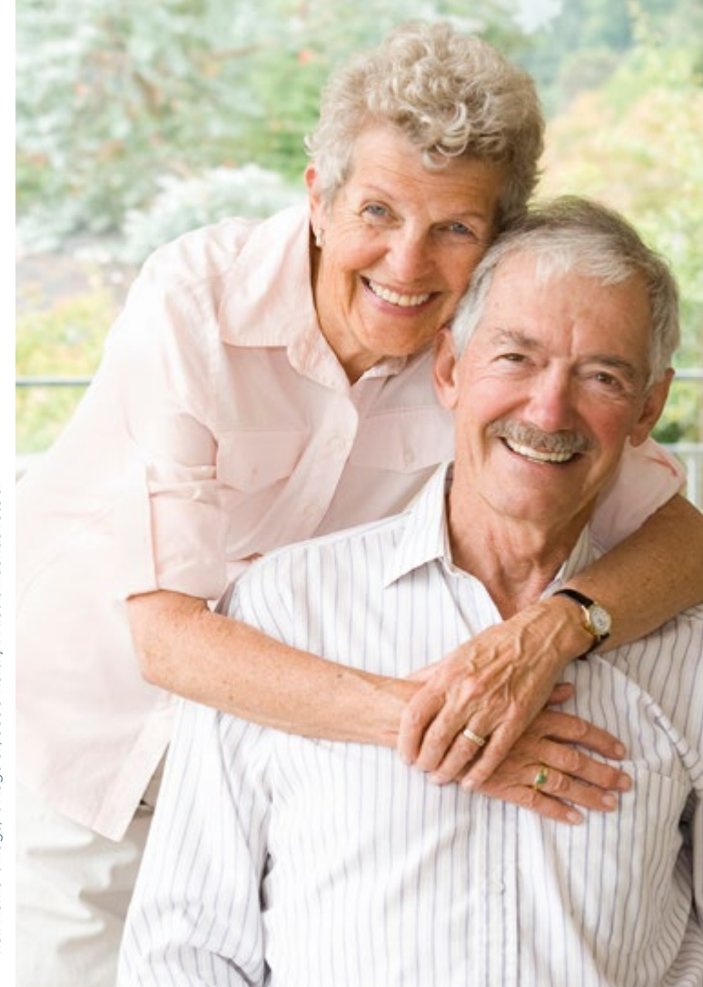
V.U.: Home 't Hoge, 't Hoge 57, 8500 Kortrijk. Niet-bindende foto's.